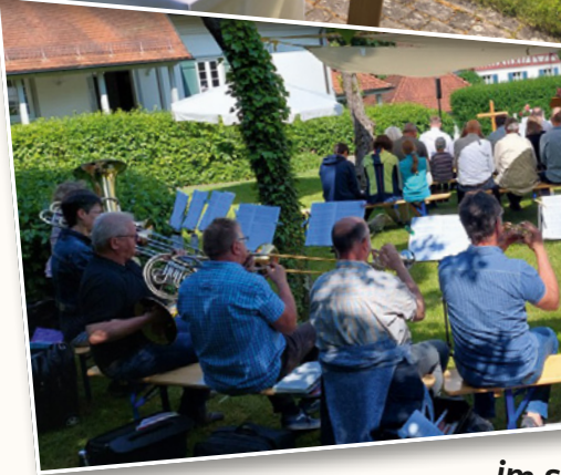
Gottesdienst der GKG im Schiefererlebnispark in Dormettingen 25. Juni 2023