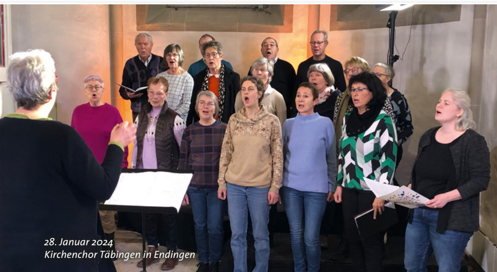
28. Januar 2024 Kirchenchor Tübingen in Endingen

Deshalb wird derzeit diskutiert, ob der für einen späteren Zeitpunkt angedachte Zusammenschluss der Gemeinden Endingen, Erzingen-Schömberg und Tübingen zu einer Kirchengemeinde schon auf den 1. Januar 2025 vorgezogen wird. Die gute Zusammenarbeit in der Gesamtkirchengemeinde haben die Kirchengemeinderäte der drei Gemeinden dazu ermutigt. Dadurch würden vor