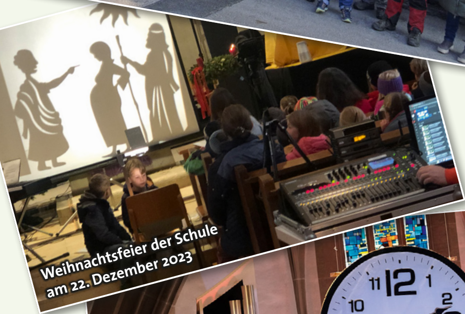
Weihnachtsfeier der Schule am 22. Dezember 2023