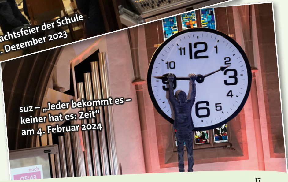
suz – „Jeder bekommt es – keiner hat es: Zeit“ am 4. Februar 2024