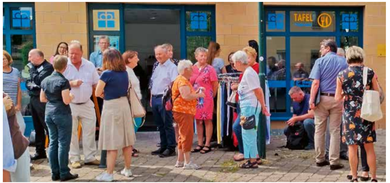
Eröffnung Diakonie- und Tafelladen Leinfelden-Echterdingen 2023

unter info@kdv-es.de , 07021 92092-26 oder auf www.kreisdiakonieverband-esslingen.de .