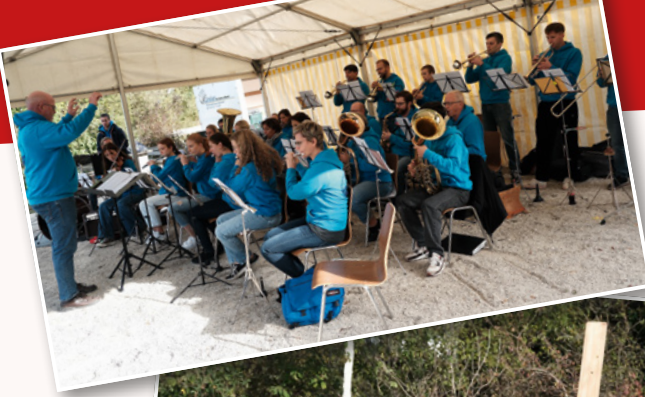
Erntedankfest 8. Oktober 2023