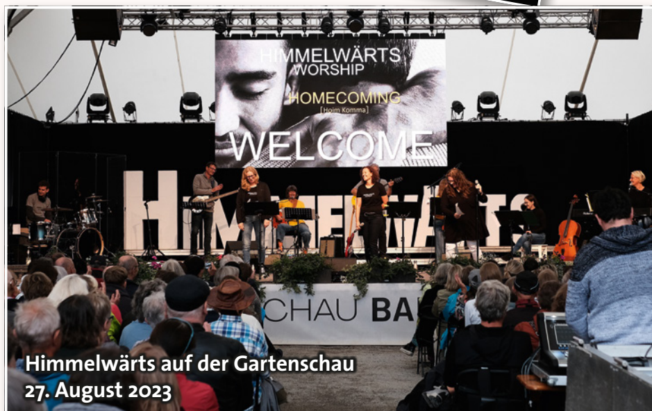
Himmelwärts auf der Gartenschau 27. August 2023